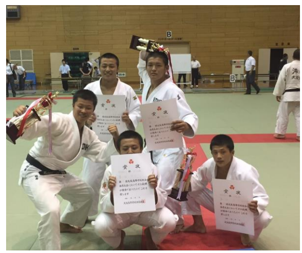
男子柔道部3年生おめでとう～!!!

最後に臨んだこの大会で優勝でき、自分が嬉しかったことはもちろんですが、振り返ってみると、毎日練習を共にした仲間、応援し続けてくれた友人や親、そして、三年間期待を持って柔道を教えてくれた先生方のおかげです。感謝してもしきれないほど、たくさんの方の支えのおかげで優勝という結果を得ることができたのだと改めて実感します。大学に進学した後も、こうした方々に柔道を通して、少しでも喜んでもらえるよう頑張りたいと思います。