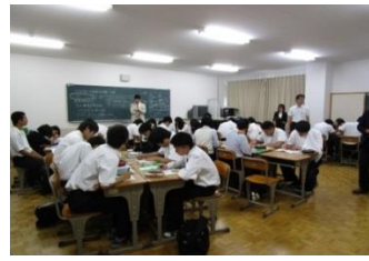
就職ガイダンスの様子

三年生全員、希望の進路に合格できるよう気を引き締め、残りの学校生活を送ってみたいと思います。